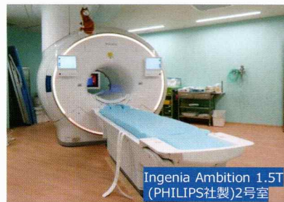
Ingenia Ambition 1.5T (PHILIPS社製)2号室