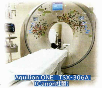
Aquilion ONE TSX-306A (Canon社製)

令和3年8月に導入されたCT装置（キヤノン社製320列）は、最上級の機種であり短時間に広範囲、高精細な画像を撮影することが可能となりました。